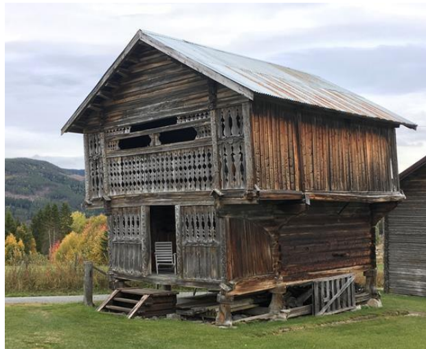
2-1 Freda stabbur på Garnås.

Thoenstua på Hallingdal Museum er også vedtaksfreda.