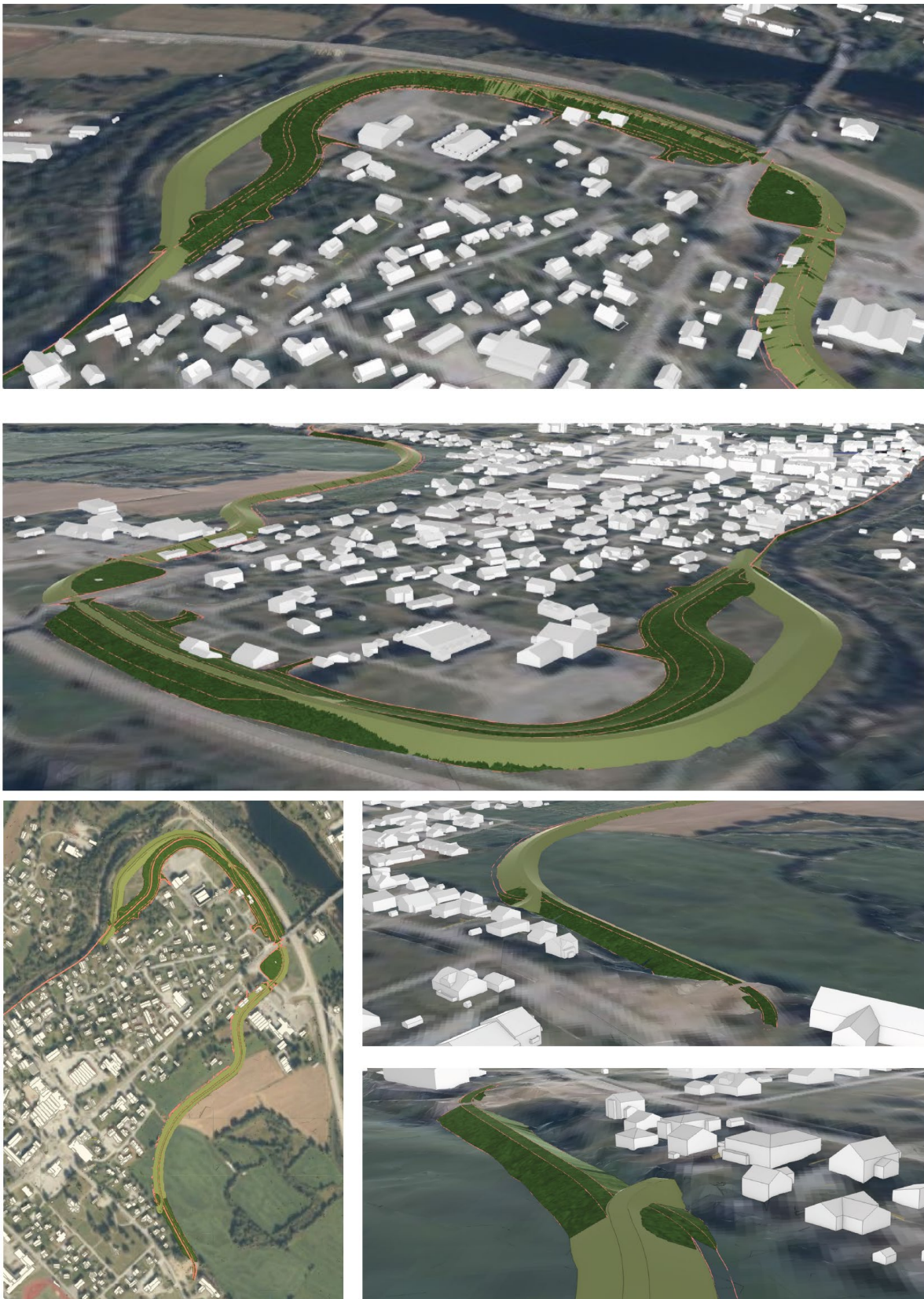
Figur 1: Utklipp fra modell viser den nye og gamle plasseringen av flomvollen. Lysegrønt er ny plassering, mens mørkegrønn er opprinnelig planlagt plassering.