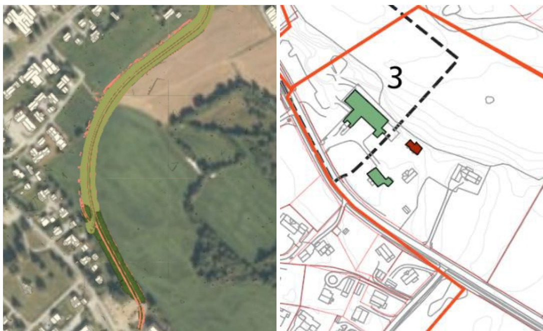
Figur 4: Ny plassering av flomvoll, med tilhørende kulturmiljø i området.

I den sørlige delen av flomvollen, vil flomvollen kortes ned og avslutte før den når kulturmiljø 3. I tidligere forslag til utforming av flomvollen, ville flomvollen avslutte tett på bebyggelsen ved Jørnmjordet/Alfarvegen, som ville påvirke opplevelsen av tunet og den opprinnelige konteksten mellom husene kraftig. Ved den nye plasseringen av flomvollen trekkes flomvollen lenger unna bebyggelsen, som gjør at den vil oppleves mindre dominerende og i mindre grad endre opplevelsen av kulturmiljøet.