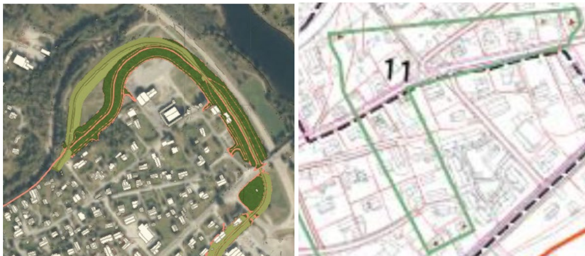
Figur 3: Ny plassering av flomvoll nord i området, med tilhørende kulturmiljø i området.

I nord vil den nye plasseringen av flomvollen trekkes lenger nordover. Dette vil i all hovedsak være positivt for bygningene i området, fordi flomvollen legges lenger vekk fra bebyggelsen og på denne måten vil oppleves mindre dominerende. Landskapet rundt flomvollen vil bli mer åpent ettersom flomvollen vil ligge lenger unna, noe som i større grad vil bevare det opprinnelige miljøet, og konteksten bygningen er en del av.