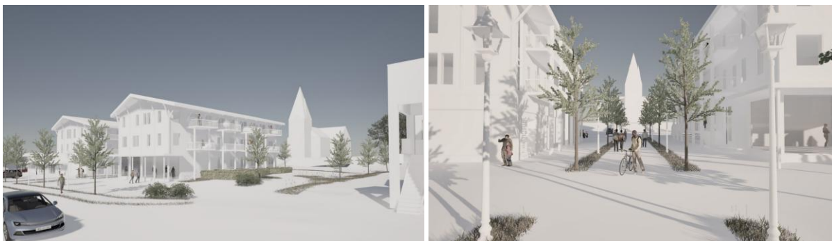
Figur 4. Prosjekt "Essotomta". Illustrasjon

Innspillet er nå innarbeidet i planbestemmelser. For å kunne sluttbehandle planen i planutvalg og kommunestyre, må endring i bestemmelser område BS1 høres med berørte parter i hht plan og bygningslovens §12-10.