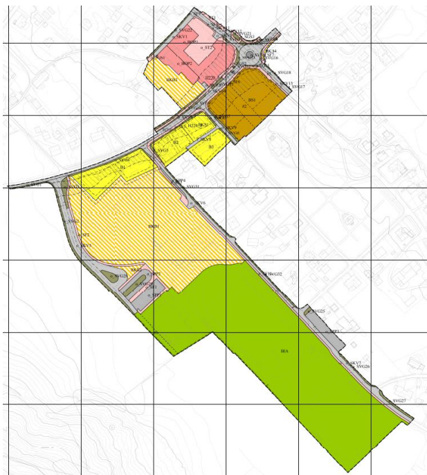
Figur 1 Kartutsnitt over planen

Oppstart av planarbeidet ble varslet 10.11.2021 med frist for merknader satt til 07.12.2021. Det kom inn 8 innspill til varslingen innen frist. Etter frist kom NVE med innspill slik at det totalt ble mottatt 9 innspill.