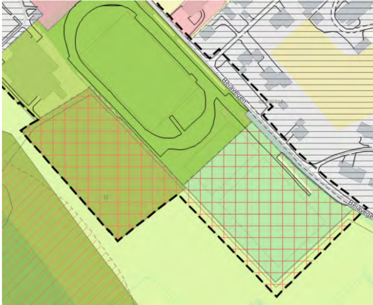
Figur 1. Kartutsnittet viser båndlagt område (rød krysskravur) og plangrense (svart stiptet linje).