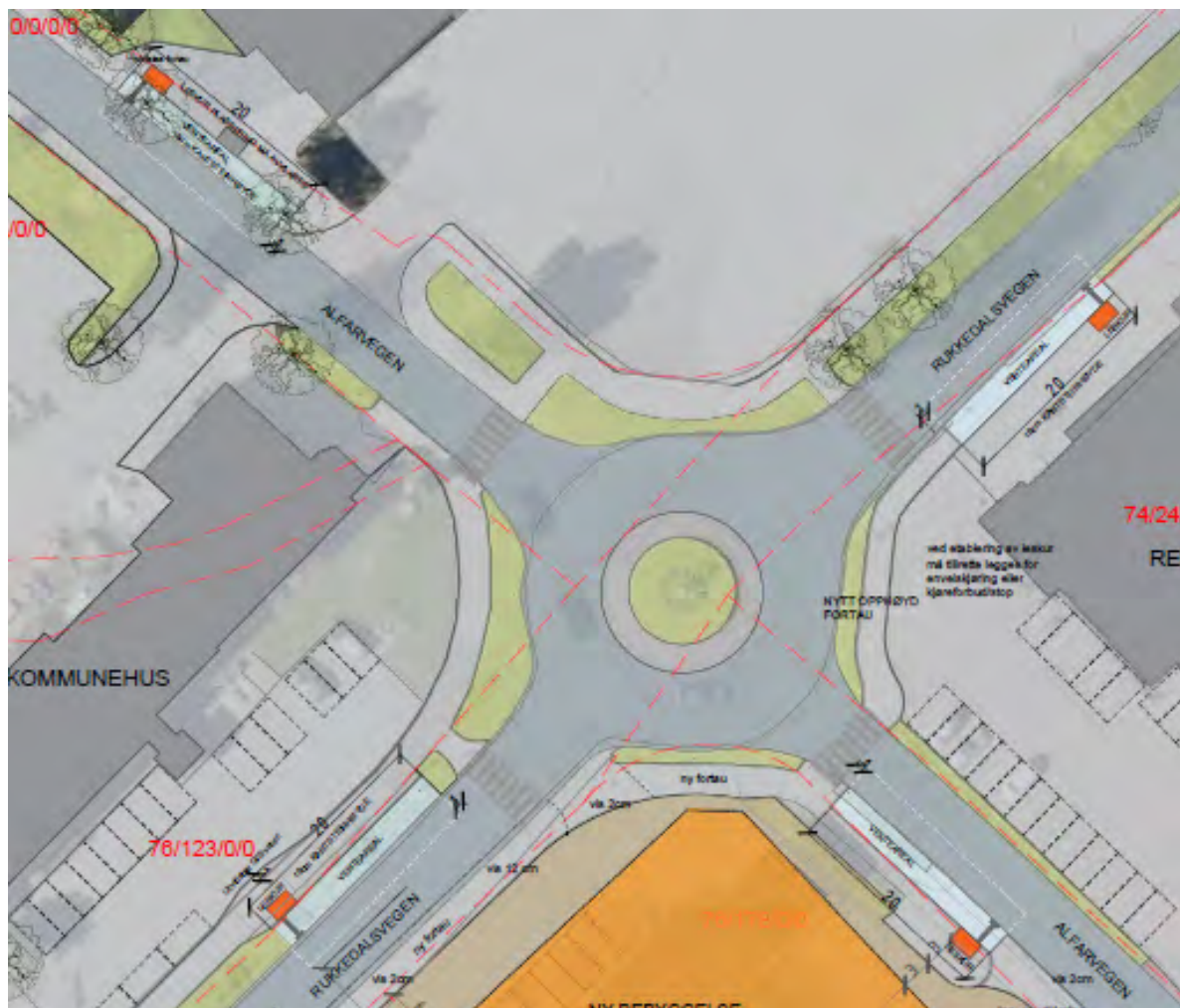
Figur 4. Foreslått knutepunkt løsning med kantstopp og venteareal (Sør Arkitekter). Kantstopp markert med lys stiplet strek, venteareal med lyseblå farge og leskur med oransje farge.

Løsningen frigjør plass på Essoplassen til andre formål som i større grad vil være med å styrke Nesbyen som sentrum. Skolebussene som har benyttet Essoplassen som «venteareal» før henting av elever ved skolen, har nå fått egne oppstillingsplasser ved skolen.