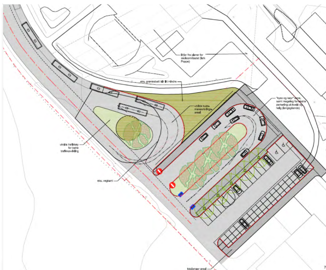
Figur 2. Ny trafikk- og parkeringsløsning ved Nesbyen skole (Asplan Viak)

Det er tatt utgangspunkt i denne mulighetsstudien ved utarbeidelse av planforslaget, men det er gjort noen vesentlige endringer av løsning som gjør at dyrka mark ikke bygges ned. Asplan Viak har stått for disse endringene.