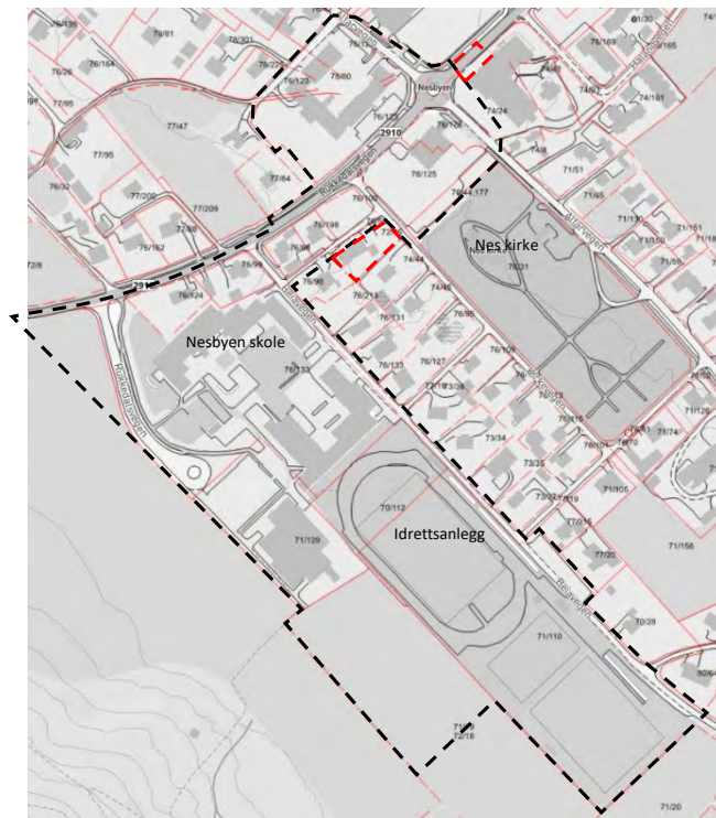
Figur 1 Kartutsnitt over planavgrensning

Sør arkitekter AS har på vegne av Nesbyen kommune / Anders Halland utarbeidet reguleringsplan for Nesbyen skole og mindre del av sentrum (planid:01202109). Formålet med planen er å legge til rette for funksjonell og trafikksikker løsning for trafikkavvikling og parkering ved Nesbyen skole. Planarbeidet skal også avklare arealbruken for skole, idrettsanlegg, mindre deler av sentrum (inkludert "Essoplassen" og Embetsgarden), samt vurdere nye forbindelser for gående og syklende langs og parallelt med Rukkedalsvegen.