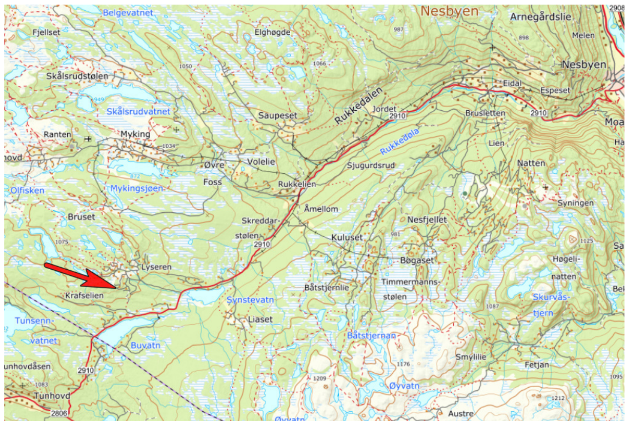
Figur 2: Oversiktskart, planområdet markert med rød pil.

For mer inngående beskrivelse av planområdet vises det til utarbeidet planbeskrivelse. I dette dokumentet beskrives kun hovedtrekk i forhold til foreslått arealbruk og eksisterende og fremtidig bruk av arealene innenfor planområdet med vekt på forhold som har betydning ROS vurderinger i saken.